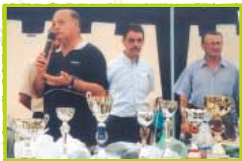
FOIRE À L'ÉCHALOTE. RENDEZ-VOUS ANNUEL DE LA MOUTADE

■ Création d'outils nouveaux pour une meilleure communication : "L'Etat du Canton de Riom Est", document annuel faisant le point des acquis et du travail restant, adressé à chaque famille, secrétariat ouvert tous les jours, permanences régulières dans chaque commune,