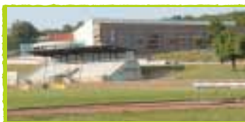
MARC GUALINO : "CETTE SALLE ÉTAIT INDISPENSABLE POUR LES ASSOCIATIONS ET POUR LES COLLÉGIENS. AVEC L'APPUI DU CONSEILLER GÉNÉRAL, NOUS AVONS PU LA CONSTRUIRE DANS D'EXCELLENTE CONDITIONS."

● Aménagements des routes départementales, notamment pont des Grosliers, rond point de Saint-Hyppolite, traversées de Châtel, et pour le centre de