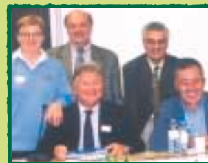
A CHATEL AVEC MICHEL JAZY ET LES ANCIENS INTERNATIONAUX D'ATHLÉTISME EN CONGRÈS.