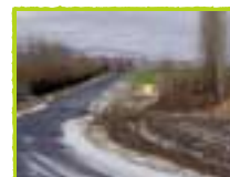
PLUSIEURS ACCIDENTS DRAMATIQUES ONT ENDEUILLÉ CE CARREFOUR, VERS LADOUX. LA LIAISON MÉNÉTROL-GERZAT EST AUJOURD'HUI EN COURS D'AMÉNAGEMENT AVEC DES BANDES CYCLABLES ET DES ROND-POINTS SÛRS.