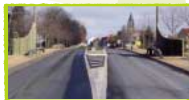
TOUTES LES SOLUTIONS ONT ÉTÉ ÉTUDIÉES POUR RÉDUIRE LA VITESSE DANS LA COMMUNE ET RELIER LES DEUX PARTIES DU BOURG COUPÉES PAR LA RN9. AUJOURD'HUI L'ENTRÉE SUD EST OPÉRATIONNELLE, AVEC DE PREMIERS EFFETS POSITIFS, LES TRAVAUX VONT COMMENCER POUR L'ENTRÉE NORD.