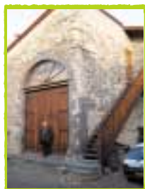
SAINT-BONNET DOIT RESTER UN VRAI VILLAGE DE TRADITION, ÉQUILIBRÉ ET ACCUEILLANT POUR LES NOUVEAUX HABITANTS.

● Appui du conseiller général pour une meilleure sécurité routière à Saint-Bonnet, interdiction aux poids lourds de traverser, rendue possible par l'ouverture du diffuseur de Combronde sur A.71.