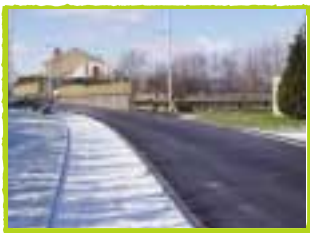
LE MAIRE DE PESSAT-VILLENEUVE A IMAGINÉ UNE PISTE POUR LES PIÉTONS ET CYCLISTES, LE LONG DE LA ROUTE DE RANDAN. AVEC L'APPUI DU CONSEILLER GÉNÉRAL, ELLE EST AUJOURD'HUI RÉALISÉE ET UTILISÉE.